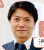
キャリアコンサルタント (部長)