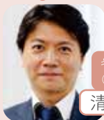
キャリアコンサルタント (部長)