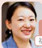
就職支援責任者 キャリアコンサルタント