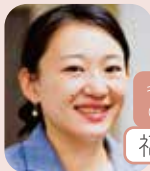
キャリアコンサルタント (エリアマネージャー)