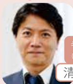
キャリアコンサルタント (部長)