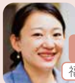
就職支援責任者 キャリアコンサルタント